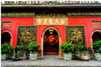
วัดต้าฉี้อ