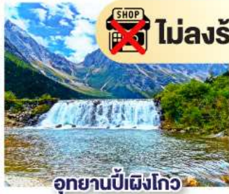
อุทยานปี่ฝิงโกว