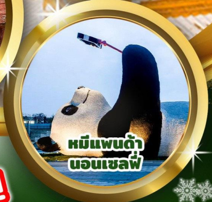
หมีแพนด้า นอนเชลฟ์