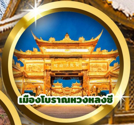
เมืองโบราณหวงหลงซี