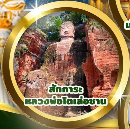
สักการะ หลวงพ่โตเล่อซาน