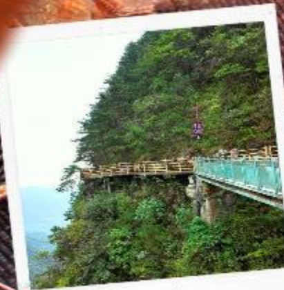
หมิงเยวี่ยซาน