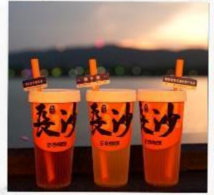
เซียงเจียงริเวอร์ไซด์