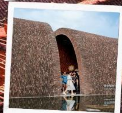
จิ่งเต๋อเจิ้น