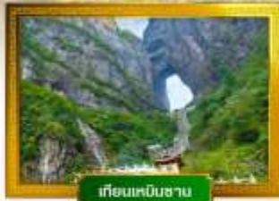
เทียนหมินซาน