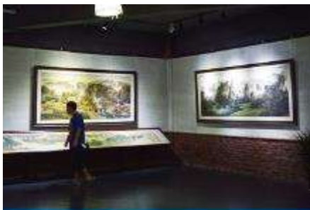
พิพิธภัณฑ์ภาพหินทราย

พักที่ ZHENMIN HOTEL โรงแรมระดับ 4 ดาวหรือเทียบเท่า