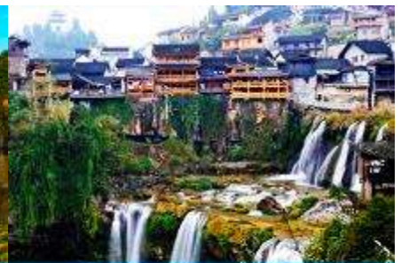
เมืองโบราณฝูหรงเจิน