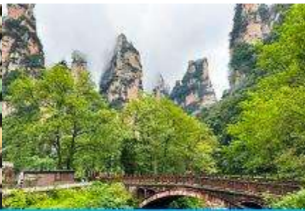
จุดชมวิวจินเปียนซี