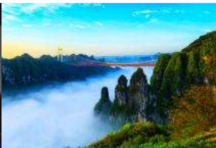
อุทยานป่าไม้แห่งชาติไ้อ้าย