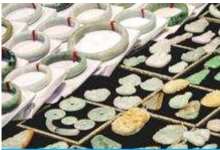
ศูนย์จำหน่ายผลิตภัณฑ์หอย