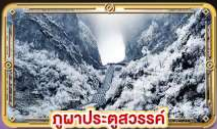
ภูเขาประตูสวรรค์