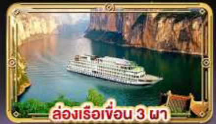
ล่องเรือเขื่อน 3 ภา