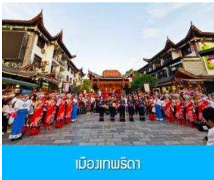
เมืองเทพริดา