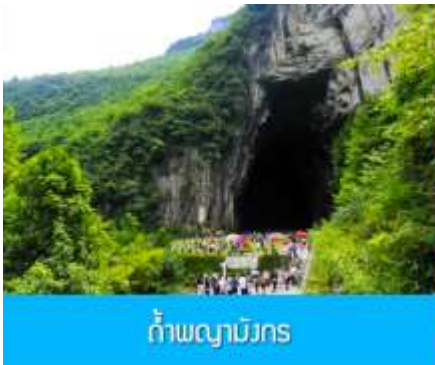
ถ้ำผญามังกร

พักที่ YICHANG HUIHAO HOTEL โรงแรมระดับ 4 ดาวหรือเทียบเท่าในเมืองหฺยซัง