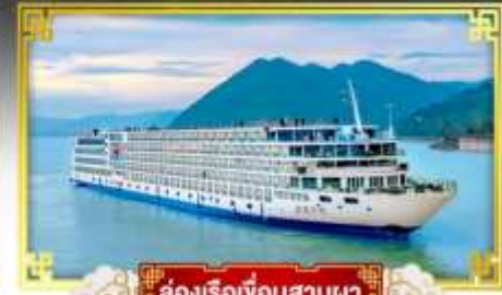
ล่องเรือเขื่อนสามผา