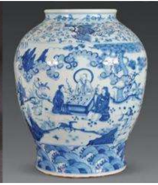
เตาเผาเครื่องลายครามจีนโบราณ

หลังอาหารนำท่านชม เตาเผาเครื่องลายครามจีนโบราณ 景德镇官窑 เป็นโรงงานผลิตเครื่องลายครามจีนโบราณที่ผลิตเครื่องใช้ต่าง ๆ (เครื่องลายคราม) อาทิ แจกันประดับบ้าน ถ้วยชาม บรรจุภัณฑ์ที่ใช้ในบ้าน เพื่อส่งถวายให้เป็นเครื่องใช้ในวังสำหรับจักรพรรดิ และพระบรมวงศานุวงศ์ เครื่องลายครามที่ผลิตจากโรงงานแห่งนี้ได้ชื่อว่าเป็นเครื่องลายครามที่ดีที่สุดในพื้นที่จีน ซึ่งของที่ผลิตได้ทุกชิ้นหลังผ่านการคัดกรองแล้วจะถูกส่งไปในพระราชวังที่กรุงปักกิ่ง ส่วนที่เหลือจากการคัดกรองจะถูกทุบให้แตกและนำมาเผาใหม่ โดยไม่สามารถนำไปขายให้กับสามัญชนทั่วไปได้.....นำท่านชมเตาเผาโบราณ และเครื่องลายครามโบราณรุ่นต่าง ๆ ซึ่งบางส่วนยังคงถูกเก็บรักษาไว้เป็นอย่างดี