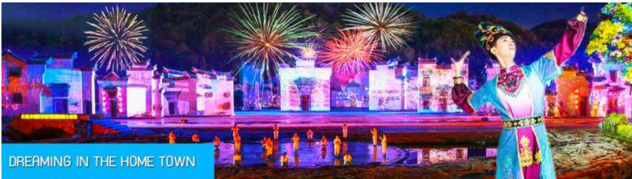
DREAMING IN THE HOME TOWN

หลังอาหารนำท่านเดินทางเข้าที่พัก หรือท่านสามารถเลือกซื้อโปรแกรมเสริม เป็นบัตรชมการแสดง ชุด DREAMING IN THE HOME TOWN เป็นการแสดงบนเวทีขนาดใหญ่ที่จัดสร้างขึ้นกลางแจ้ง ท่ามกลางธรรมชาติที่มีภูเขาเป็นฉากหลัง ใช้ทุนสร้างกว่า 280 ล้านบาท เป็นการแสดงที่น่าดูชมที่สุดในมณฑลเจียงซี แต่ละฉากการแสดงมีการออกแบบเวที ฉากประกอบที่พิถีพิถัน ประณีต และอลังการ ใช้ทีมงานนักแสดงหลายร้อยคน และระบบแสง สี เสียงที่ทันสมัยประกอบในการแสดง