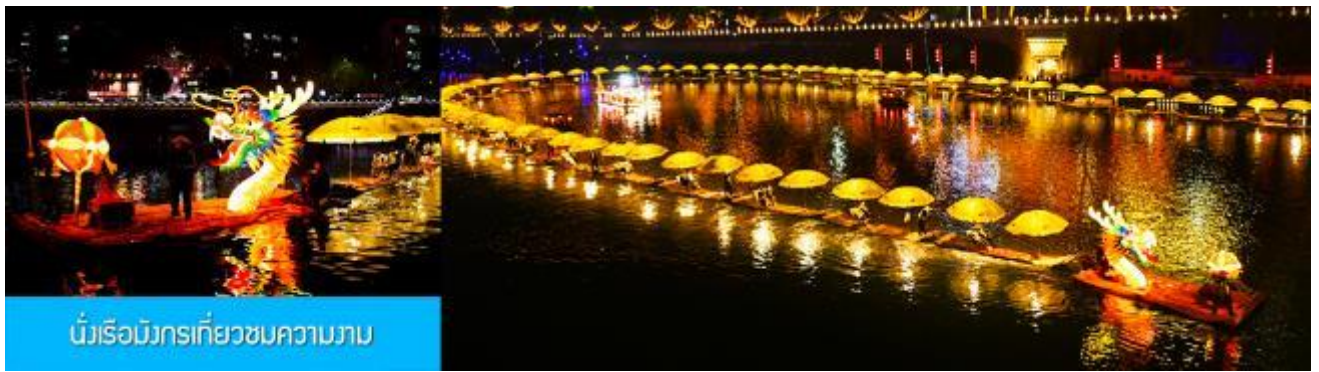
นั่งเรือมังกรเที่ยวชมความงาม

หลังอาหารนำท่านเดินทางเข้าที่พัก หรือท่านสามารถเลือกซื้อ โปรแกรมเสริม เป็นตัวนั่งเรือมังกรเที่ยวชมความงามของ บ้านเรือนและสิ่งปลูกสร้างสองฝั่งแม่น้ำในช่วงที่สวยงามที่สุดของเมือง เซียนเอิน ที่ประดับประดาด้วยแสงสี และได้ชื่อว่าเป็นวิวยามค่ำคืนที่สวยงามที่สุดในมณฑลหูเป่ย์ เช่นเดียวกับเมือง โบราณฟงหวงในมณฑลหูหนาน..... อัตราค่าบริการสำหรับ โปรแกรมเสริมนั่งเรือมังกรชมวิวยามค่ำคืน ท่านละ 190 หยวน หรือ 950 บาท ระยะเวลาที่ใช้ในการเรือมังกร ประมาณ 45 นาที ค่าบริการรวม ค่าบัตรเข้าชม ค่ารถรับ ส่ง และค่าน้ำดื่มของไกด์ท้องถิ่น