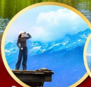
ร้าน Coffee Yun Di An