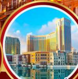
เดอะเวเนเชียน