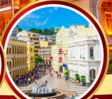
เซนาโตสแควร์