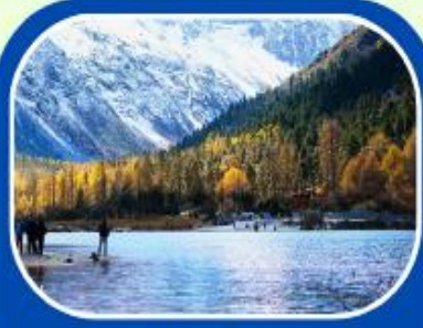
ป่ผิงโกว

เดินทาง : 17-22 พค // 20-25 มิย 8-13 กค 2568