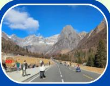
ภูเขาสีดรุณี