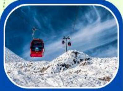
ต้ากู่ปิงชวน

ทัวร์ไม่ลงร้าน+ไม่ขายออฟชั่น+บินFullService