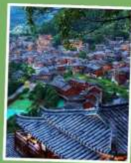
หมู่บ้านแม้วซีเจียง