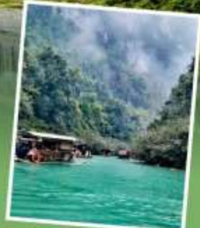
อุทยานต้าซีโขง