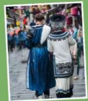
เมืองโบราณชิงเหยียน