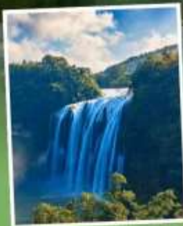
น้ำตกหงงกั๋วซู่