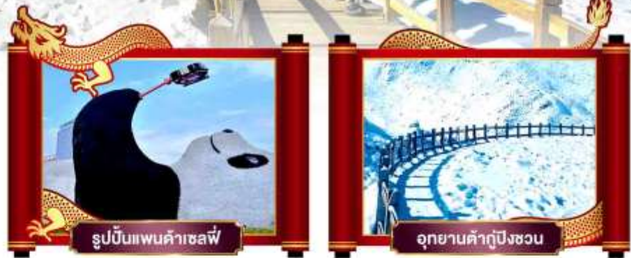
รูปปั้นแพนด้าเซลฟี