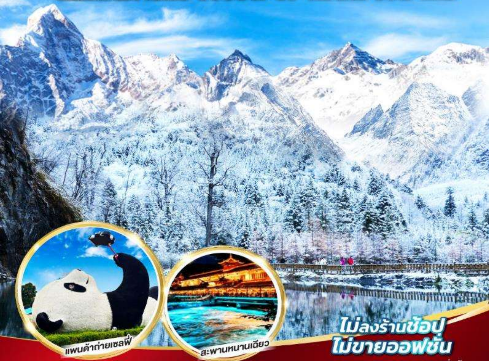
แพนด้ายักษ์

หมี่แพนด้ายักษ์ ซุปปิ้งPOP MART 5วัน 4คืน