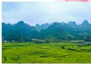
ป่าภูเขาหมื่นยอด