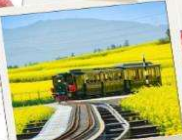
ทุ่งดอกทุ่งดอก มัสตาร์ด