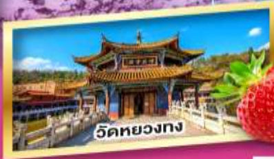
วัดหอยทง