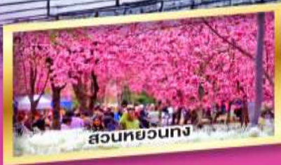
สวนหอยทง