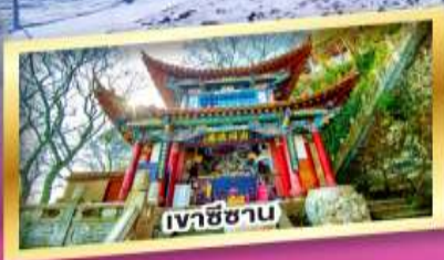
เวาชีซาบ