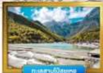
ทะเลสาบป๋อซูหยง