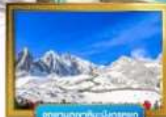
อุทยานภูเขาหิมะมังกรหยก

เดินทางโดยสารการบินจีนนำอิสเทิร์นแอร์ไลน์