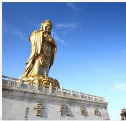
เกาะผู้ไถวซาน