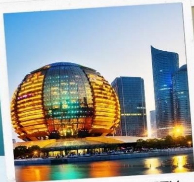
HANGZHOU CITY BALCONY