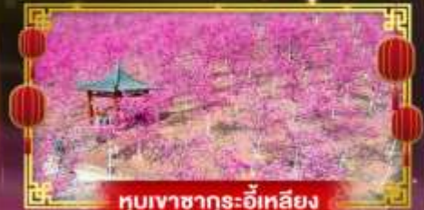
หุบเขาชากูระอิ๋นเหลียง