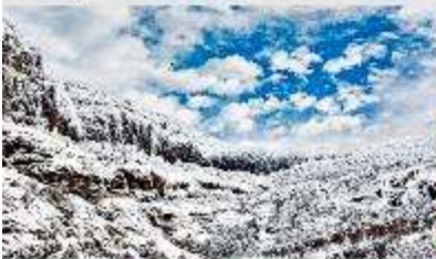
ภูเขาหิมะเจียวจื่อ