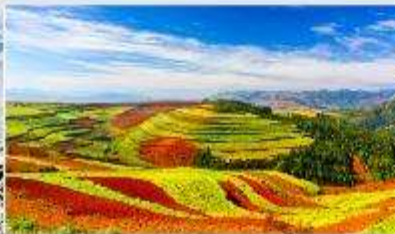
แผ่นดินสีแดง