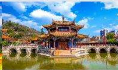
วัดหยวนทง