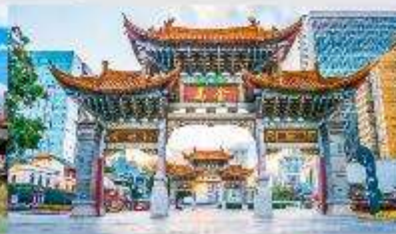
ประตุน้ำทอง ไท่หยก

*ทางบริษัทฯ ขอสงวนสิทธิ์ในการสลับโปรแกรมทัวร์ตามความเหมาะสมขึ้นอยู่กับสถานการณ์หน้างาน โดยคำนึงถึงผลประโยชน์ของลูกค้าเป็นสำคัญ