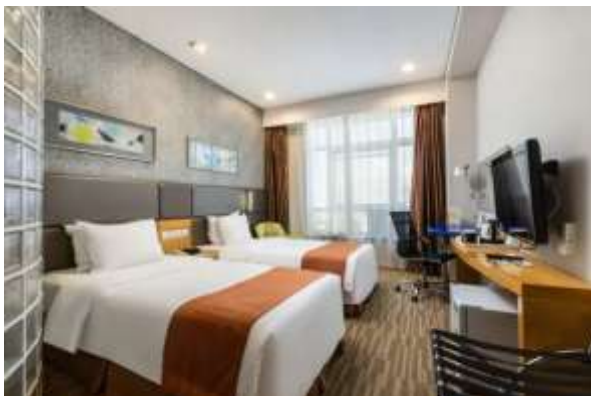
Holiday Inn Express Hotel