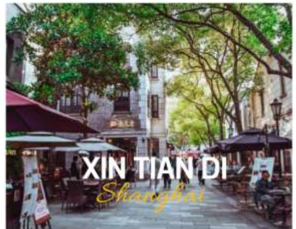
XIN TIAN DI Shanghai

ย่านใหม่ใจกลางเมืองเซี่ยงไฮ้ อีก 1 ย่านช้อปปิ้งและร้านอาหาร ร้านอาหาร ที่มีเอกลักษณ์ จากสถาปัตยกรรมที่ใช้อิฐบล็อกแบบสถาปัตยกรรมชิคเก๋มึน ซึ่งเป็นการผสมผสานกันระหว่างสถาปัตยกรรมจีนกับตะวันตกเข้าด้วยกัน ท่านจะพบกับทางเดินหิน กำแพงหิน ประติมากรรม ที่มีเอกลักษณ์ โดย 2 ทางของถนนมีต้นเมเปิ้ลตลอดทาง ยิ่งทำให้ย่านนี้มีเสน่ห์เพิ่มเป็นเท่าตัว