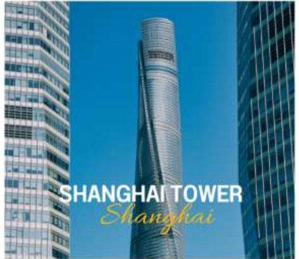
SHANGHAI TOWER Shanghai

เป็นหนึ่งในตึกระฟ้าที่ยิ่งใหญ่ที่สุดในโลกและเป็นสัญลักษณ์ของการพัฒนาและความเจริญก้าวหน้าของเมืองเซี่ยงไฮ้ในช่วงทศวรรษที่ผ่านมาตึกนี้ไม่เพียงแต่มีความสูงที่น่าประทับใจแต่ยังเป็นสัญลักษณ์ของความทันสมัยและนวัตกรรมในด้านสถาปัตยกรรมและวิศวกรรมความสูงเซี่ยงไฮ้ทาวเวอร์มีความสูง63เมตรตึกที่สูงที่สุดในจีน และ อันดับที่ 2 ของโลก รองจาก เบิร์จคาลิฟา ที่ดูไบ ตึกนี้มี 128 ชั้น โดยมี 5 ชั้นใต้ดิน และการออกแบบที่มีการลดขนาดตัวอาคารจากฐานขึ้นไปยังชั้นบนทำให้รูปร่างของตึกดูเหมือน"ขดลวด"หรือ "เกลียว"ซึ่งช่วยให้ตึกมีความมั่นคงและสามารถต้านทานลมแรงได้ดี กระจกโปร่งแสงและเหล็กกล้าเพื่อให้ตึกมีลักษณะทันสมัยและสะท้อนความเป็น เมืองแห่งอนาคต