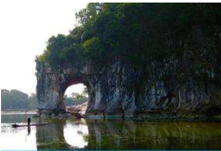
เขาวงว้าง

พักที่ GUILIN VIENNA HOTEL โรงแรมระดับ 4 ดาวท้องถิ่น หรือเทียบเท่าในเมืองกุ้ยหลิน