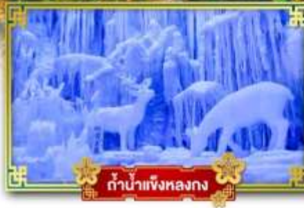
ตำนานแห่งหลงกง