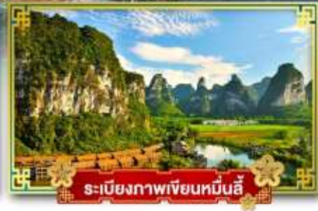
ระเบียงภาพเขียนหมิ่นลี่