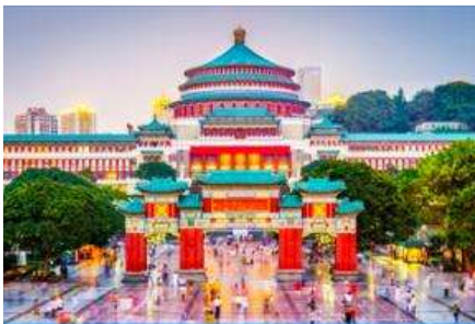
ศาลาประชาชน

พักที่ DAWEI YING HOTEL โรงแรมระดับ 4 ดาวหรือเทียบเท่าในเมืองอู่หลง