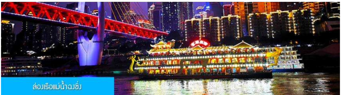
ล่องเรือแม่น้ำจางซี

รับประทานอาหารค่ำ ณ ภัตตาคาร (เมนูสุกี้หม่าล่าต้นตำหรับจงชิ่ง)