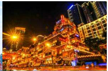
ย่านหยงหยาดัง