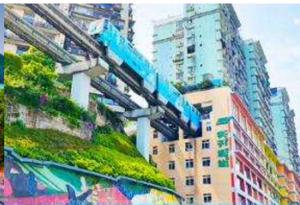
รถไฟวิงทะเลติก