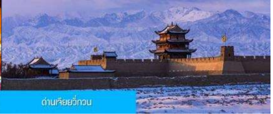
ด่านเจียยวี่กวน

วันที่สาม เมืองจางเยี่ย – วัดพระใหญ่เมืองจางเยี่ย –เดินทางสู่เมืองเจียยวี่กวน-ด่านเจียยวี่กวน