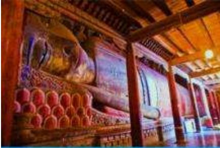
วัดพระใหญ่

พักที่ SI LU QIAN XI HOTEL โรงแรมระดับ 4 ดาวท้องถิ่น หรือเทียบเท่าในเมืองจางเยี่ย