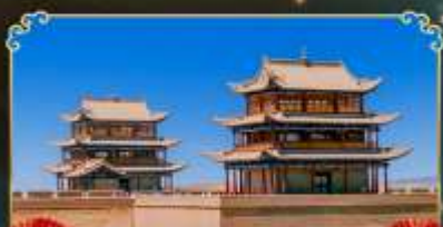
กำแพงเมืองจีนเจียวอวี่กวน