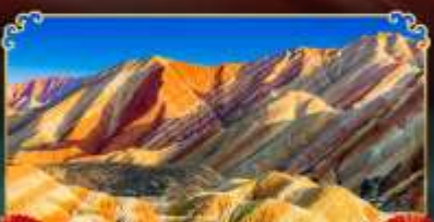
ภูเขาสายรุ้งจางเย่

เดินทางตามรอยเส้นทางสายประวัติศาสตร์โลก ชมโอเอซิสกลางทะเลทราย "ทะเลสาบพระจันทร์เสี้ยว"