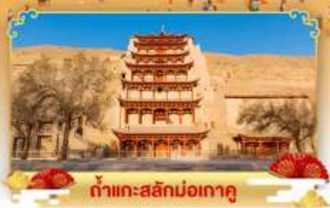
กำแพงสลักม่อเถาตู

เดินทางโดย : สายการบินไชน่าอีสเทิร์นแอร์ไลน์ & เซี่ยงไฮ้แอร์ไลน์