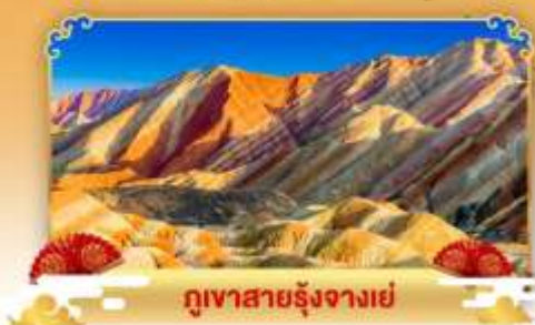
ภูเขาสายรุ้งจางเย่