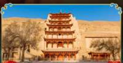
กำแพงสลักม่อเถาตุ