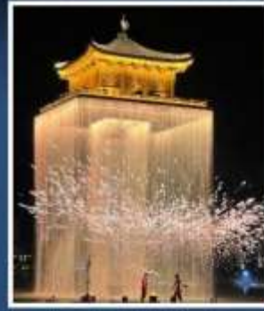
อันวี้โจว