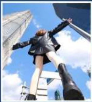
3 ตึกใหญ่แห่งเซียงอี้