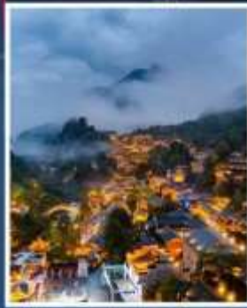
หุบเขาเทวดาวังเซียนกู่