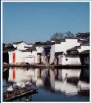
หมู่บ้านโบราณเจิ้งช่าน