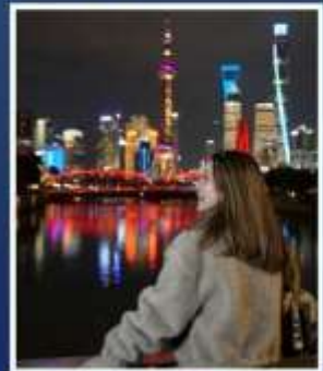
เซียงอี้ คลาสสิก ไนท์