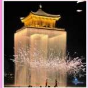
อุ๊นวีโจว