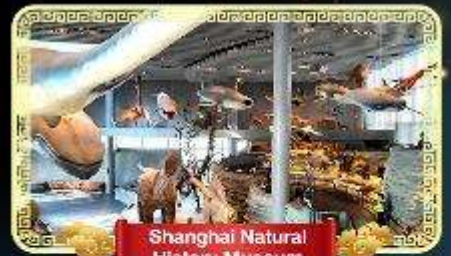
Shanghai Natural History Museum