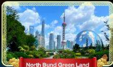
North Bund Green Land