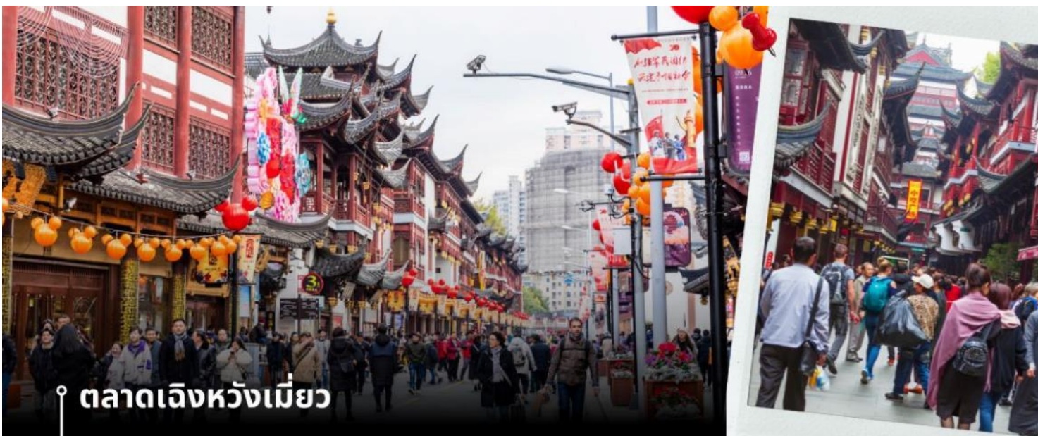
ตลาดเจิงหวังเมี่ยว

นำท่านเดินทางกลับสู่มหานครเซี่ยงไฮ้ โดยใช้เวลาเดินทางประมาณ 2 ชั่วโมง จากนั้นนำท่านชม ตลาดเจิงหวังเมี่ยว หรือเป็นที่รู้จักในชื่อ ตลาด 100 ปี เจินหวังเมี่ยว เมืองเซี่ยงไฮ้ (Chen Wang Miao) ถือว่าเป็นตลาดเก่าของผู้ตั้ง เมืองเซี่ยงไฮ้ อาคารบ้านเรือนบริเวณนี้เป็นสถาปัตยกรรมโบราณสมัยราชวงศ์หมิงและชิง ตกแต่งสไตล์สถาปัตยกรรมแบบโบราณจีน และเก่ากว่าร้อยปี