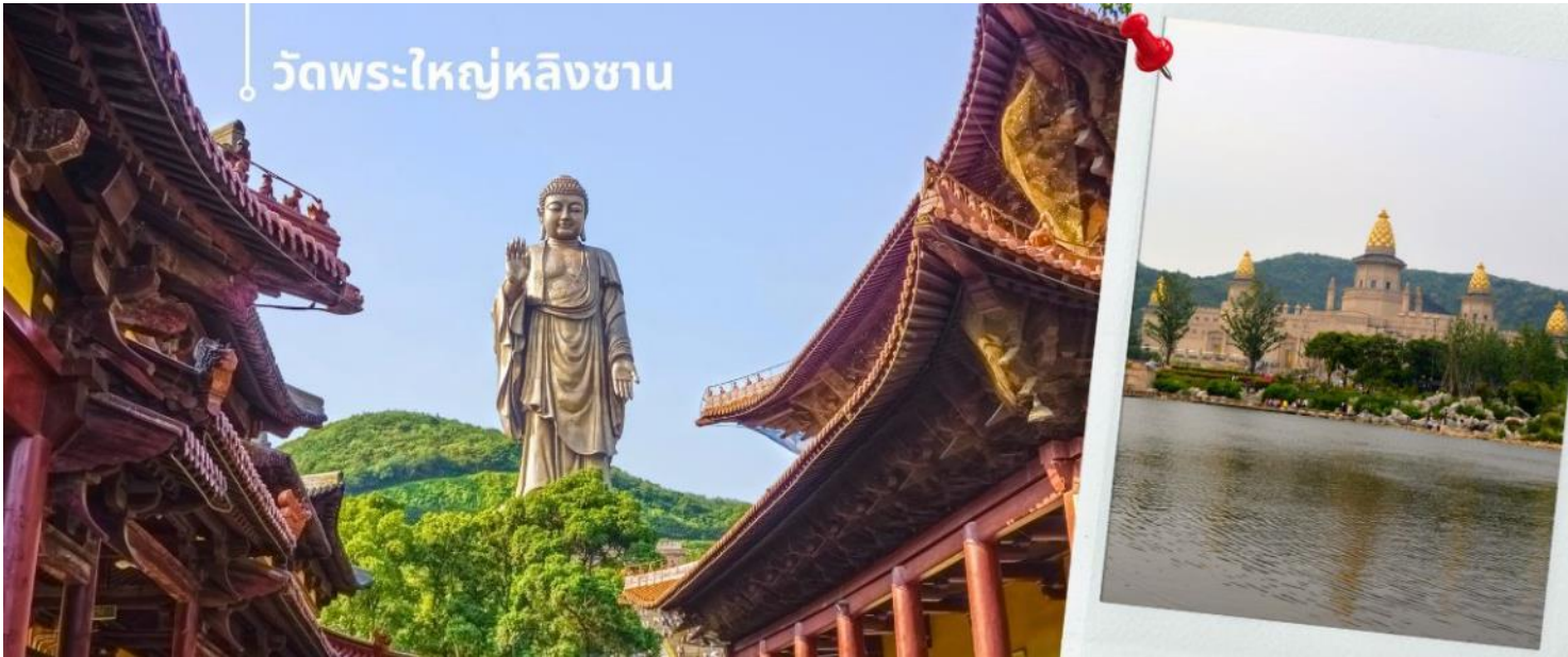
วัดพระใหญ่หลิงชาน

จีนและไต้หวัน เป็นพระพุทธรูปปางยืนของพระอมิตาภพุทธะแบบสัมฤทธิ์กลางแจ้ง หนักกว่า 7,000 เมตริกตัน สร้างเสร็จเมื่อปลายปี ค.ศ. 1996 มีความสูงกว่า 88 เมตร (289 ฟุต) รวมฐานบัว 9 เมตร นักท่องเที่ยวทั้งชาวจีนและชาวต่างชาตินิยมมาขอพรเพื่อความสิริมงคลและความสำเร็จในหน้าที่การงาน การเดินทางให้แคล้วคลาดปลอดภัย โดยการกราบและลูบที่เท้าทำน ซึ่งภายในพระพุทธรูปยังมีพิพิธภัณฑ์ชีวประวัติของท่านให้ได้เรียนรู้อีกด้วย ภายในประกอบไปด้วย ตำหนักผานกง หรือ ศาลาผานกง ตั้งอยู่ที่ริมทะเลสาบไท่หู ทางตะวันออกของพุทธอุทยาน ก่อสร้างราวปี 2006 บนเนื้อที่กว่า 7 หมื่นตารางเมตร เป็นที่รวมของศิลปวัฒนธรรมอันหลากหลายของพุทธศาสนาในแต่ละนิกายและแต่ละประเทศได้อย่างงดงามลงตัว จนถูกเรียกขานว่าเป็น พิพิธภัณฑ์พุทธศิลป์ร่วมสมัยแห่งประเทศไทย เพราะเป็นที่รวมของพิพิธภัณฑ์ นิทรรศการ โรงละคร คอนเสิร์ต และงานพุทธศิลป์มากมาย ที่น่าตื่นตาตื่นใจ