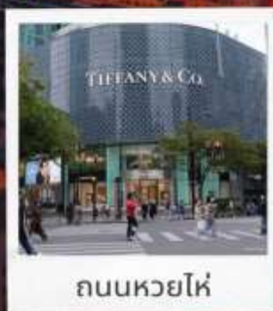
ถนนหวยไห่