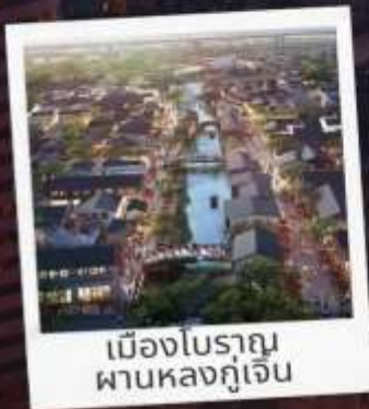
เมืองโบราณ ผานหลงกุเจิน