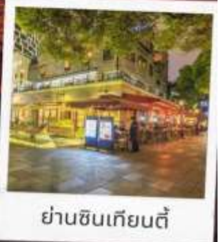
ย่านซินเทียนตี้