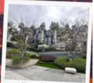
Tian An 1,000 Trees Square