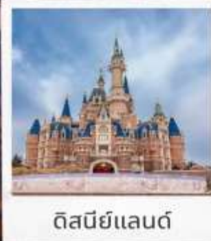
ดิสนีย์แลนด์