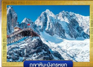
กุเวาเหมยหลี่