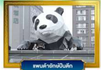
แพนด้ายักษ์ปิ่นตึก