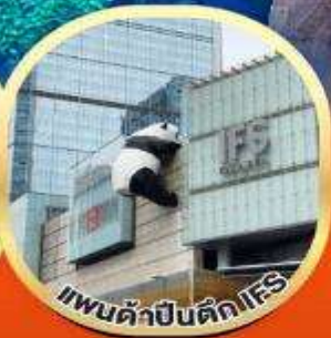
แพนด้าปิ่นดัก IFS