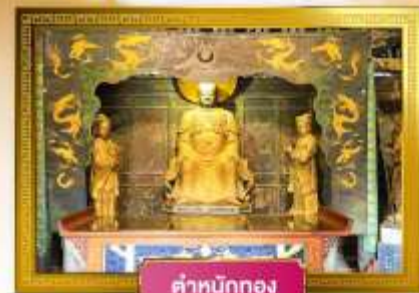
ตำหนักทอง