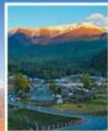
หมู่บ้านไปฮาปา