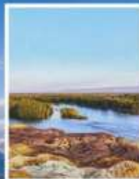
ธารน้ำ 5 สี