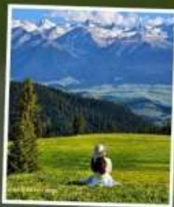
ทุ่งหญ้านาคาลาจัน