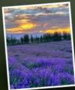
ทุ่งดอกลาเวนเดอร์