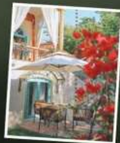
หมู่บ้านคางจันฉี