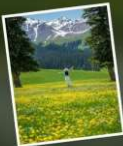
ทุ่งหญ้านาราตี

รับฟรี!! AIG ประกันสุขภาพ และ อุบัติเหตุ 2 ล้านบาท