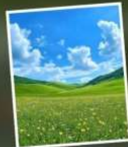
ทุ่งหญ้าแห่งท้องฟ้า