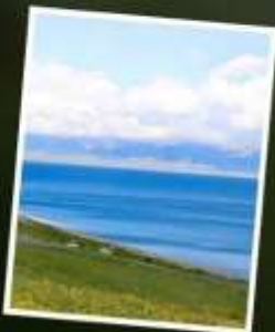
ทะเลสาบไซหลี่มู่