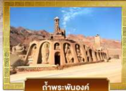
ก้ำพระปันองค์