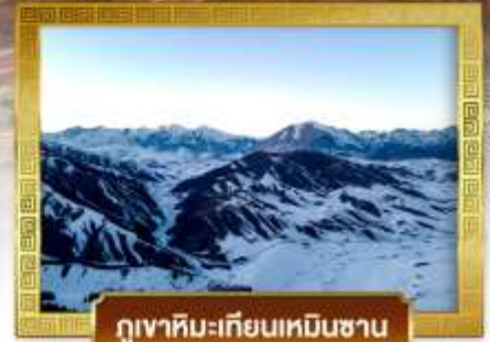
ภูเขาหิมะเทียนเหมินซาน