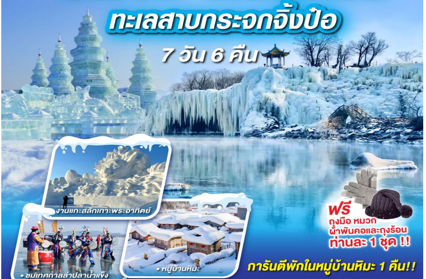
งานแกะสลักเทว-พระอาทิตย์