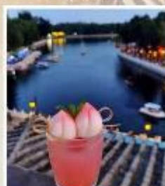
TANG FANG CAFE