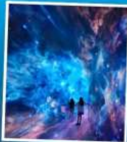
SPACE & TIME CUBE