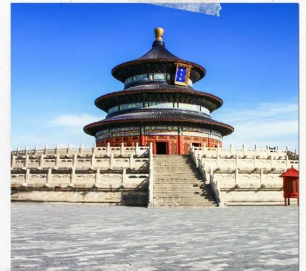
หอบูชาเทียนถาน