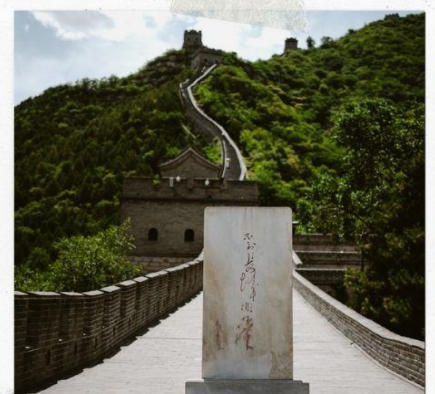
กำแพงเมืองจีน ด่านฉวิหยงกวน