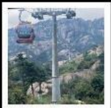
เขาหลงซาน