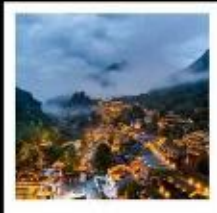
หุบเขาเทวดาฉางเฉียนถู่