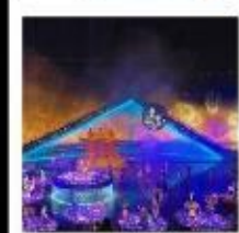
โชว์ ENCOUNTER WITH WUYUAN