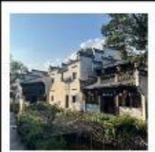
หมู่บ้านสุขุม่อช่างเหอ