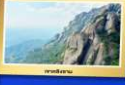
เขาตีสถาน