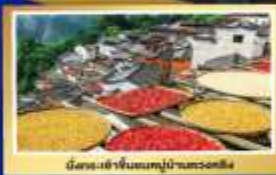
เมืองโบราณหมู่บ้านทวดอวี่