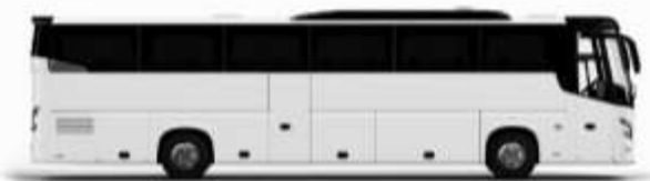
ตัวอย่างรถทัวร์ 1 คัน

ค่าที่พักตามที่ระบุในรายการหรือเทียบเท่าระดับเดียวกัน (พักห้องละ 2 ท่าน) หากประเภทห้องพักท่านริควงมาเป็นอีก เช่น ริควงห้องพักเป็น TWIN BED หรือ DOUBLE BED ทางบริษัทขอสงวนสิทธิ์ในการปรับประเภทห้องพัก เป็นตามที่โรงแรมมีอยู่ โดยไม่ต้องแจ้งให้ทราบล่วงหน้า